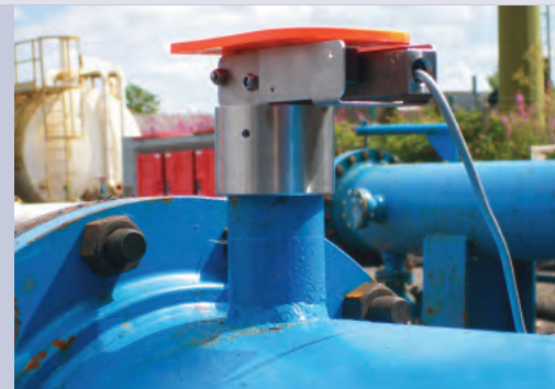
Устройство сигнализации прохода скребка на трубопроводе