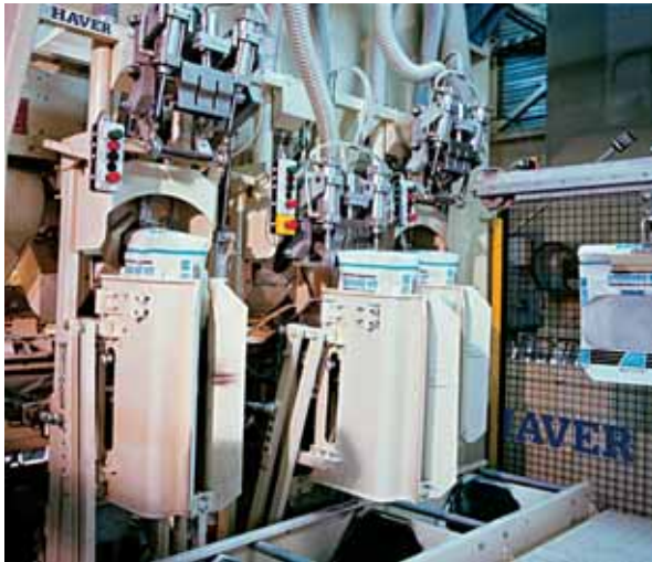
Затаривающая машина для клапанных мешков, предназначенная для порошкообразных продуктов

упаковки. Поэтому различные упаковочные системы позволяют применять самые разнообразные конструкции клапанных мешков.