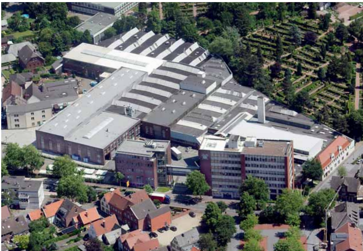
Главное управление и завод I в городе Ольде

Как компания, поставляющая комплексные технологии, HAVER & BOECKER занимает ведущее место на международном рынке взвешивающей, упаковочной и подготовительной техники. Специализируясь на затаривании и подготовке сыпучих материалов всех видов, группа предприятий занимается разработкой, производством и сбытом обширного диапазона систем и установок с разнообразным уровнем автоматизации – целенаправленно, в зависимости от задач и потребностей.