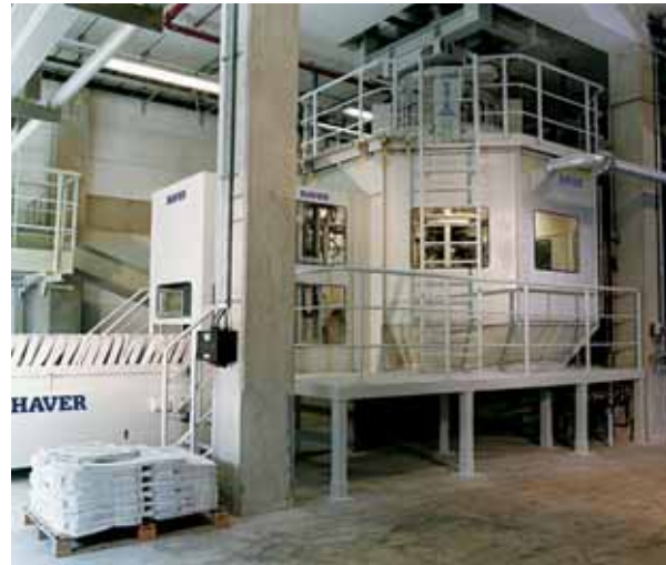
Упаковочная система ROTOSEAL® для порошкообразных продуктов