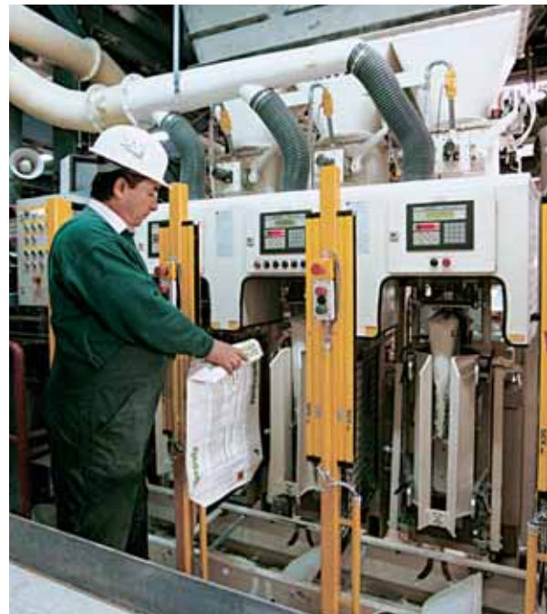
Стационарная установка с ручным или автоматическим управлением для фасовки в клапанные мешки