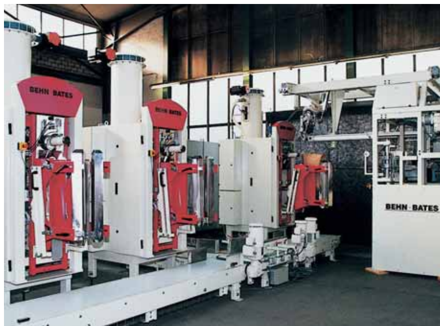
3 пневматических упаковочных установки с автоматом-насадкой клапанных мешков и станцией закрытия, смонтированной на манипуляторе насадки