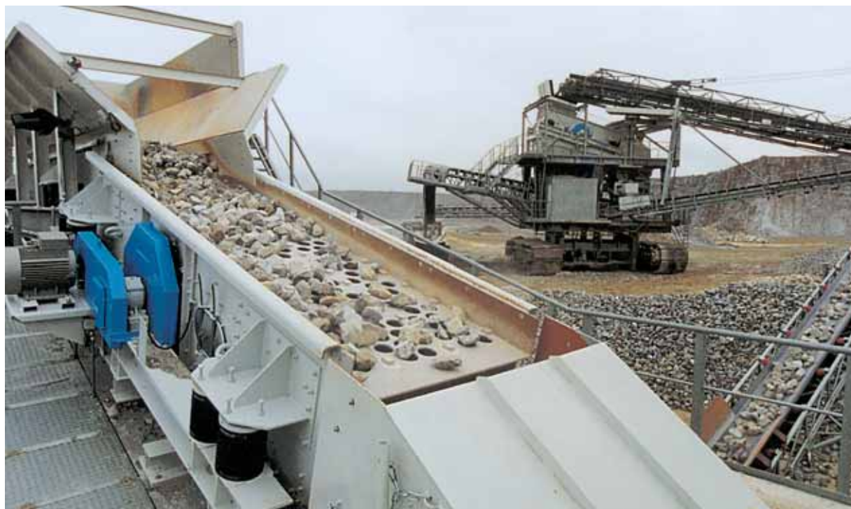
гусеничные мобильные просеивающие установки и отсеивание известковой пыли