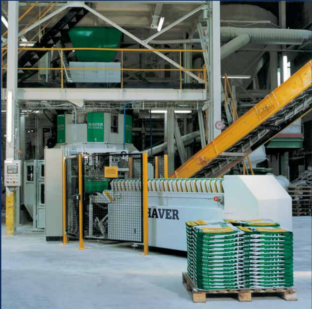
Установка H A V E R R A D I M A T в стандартном исполнении – основа высокого потенциала производительности