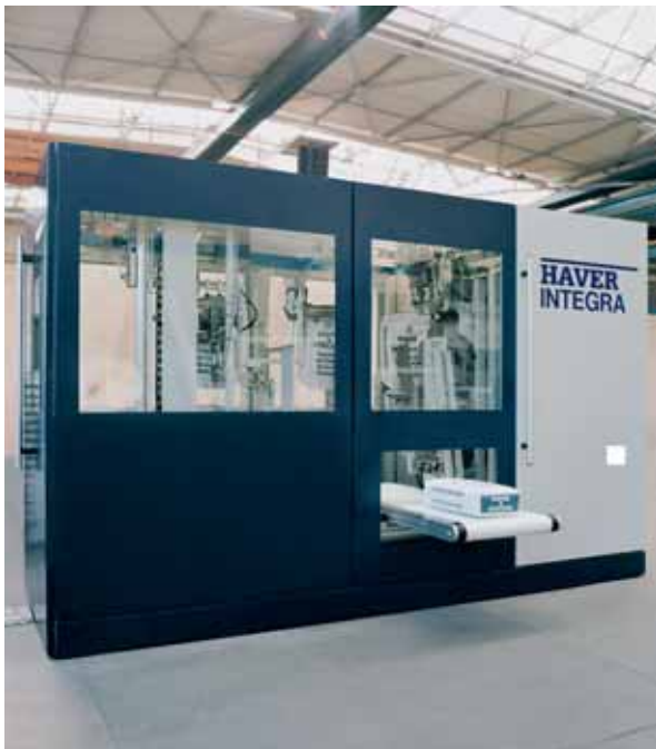
Фасовочная установка Haver INTEGRA для затаривания сыпучих материалов в ПП, в ПЭ и бумажные клапанные мешки