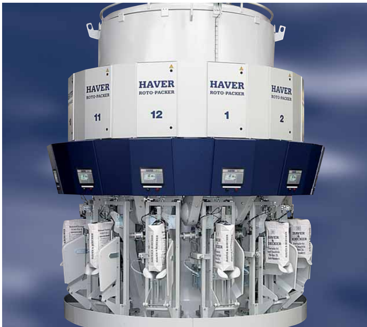
РОТО-ПАКЕРА HAVER 12 RSE составляет 4.500 мешков в час