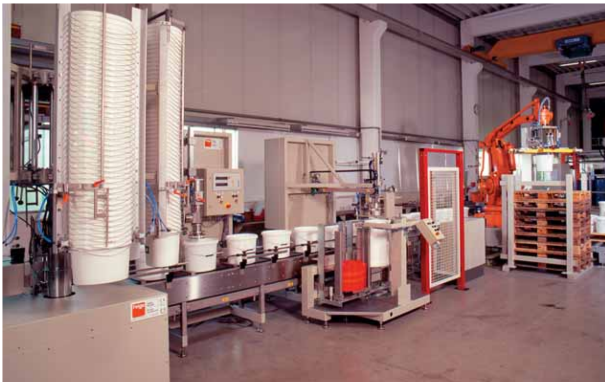
Установка для фасовки в ведра