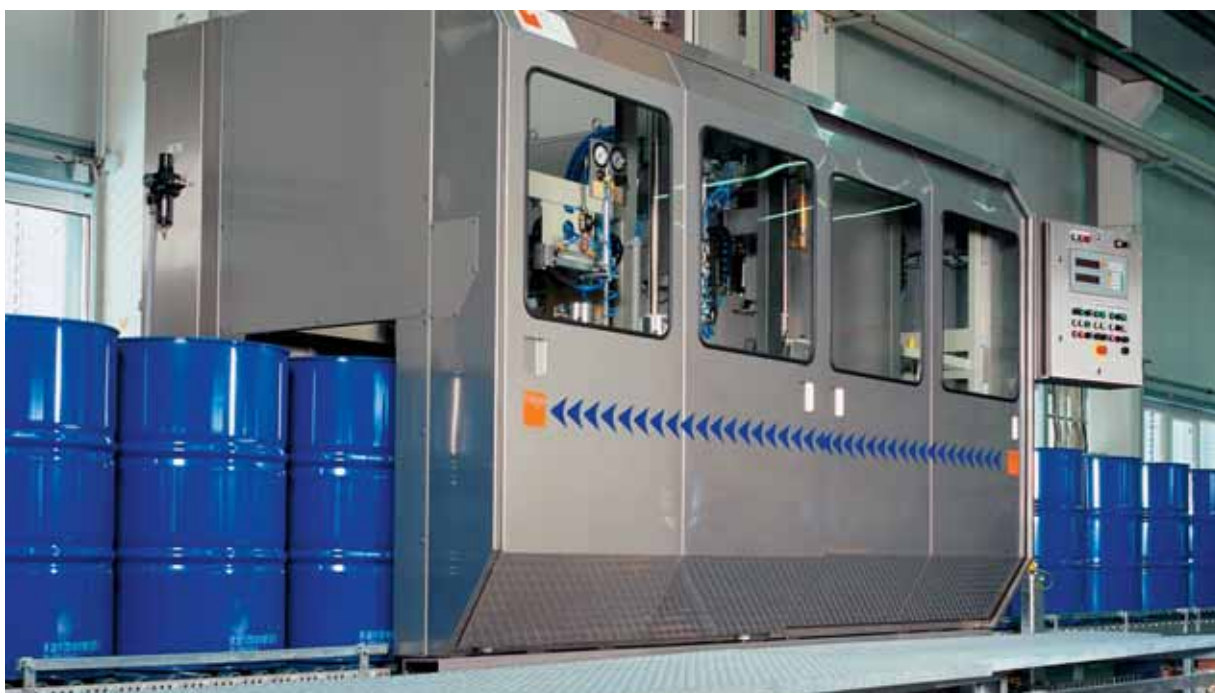
Автоматическая линия для фасовки в бочки