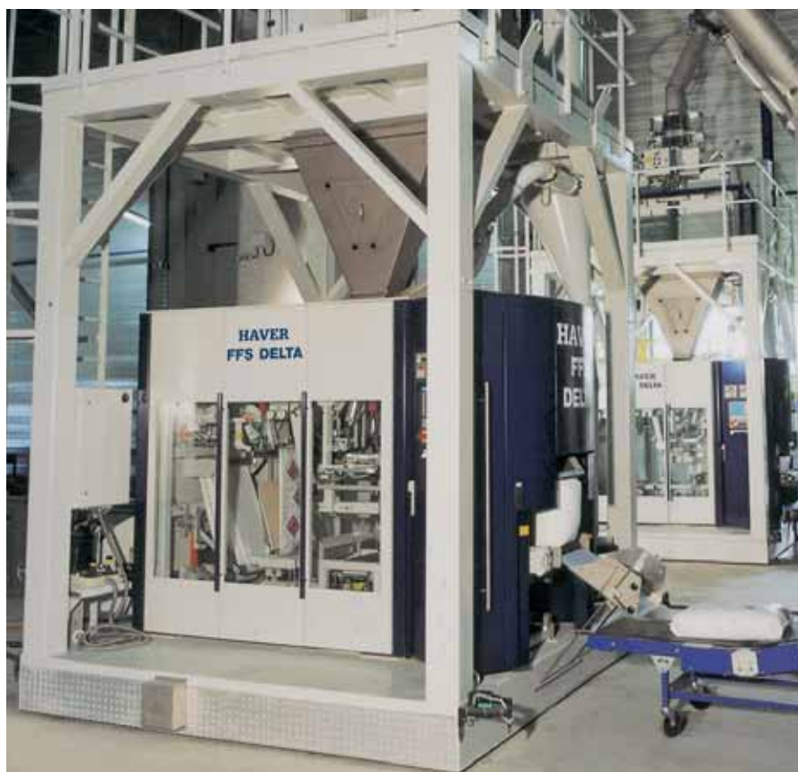
Автомат HAVER FFS тип DELTA

гранулированных, зернистых, крупчатых или порошкообразных сыпучих продуктов упаковочные системы HAVER FFS всегда являются наилучшим решением.