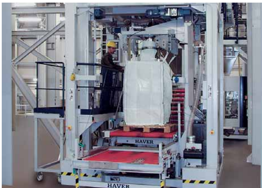
Установка для фасовки в Биг-Беги