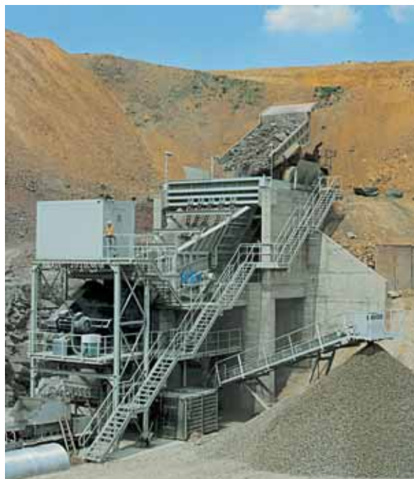
предварительные дробильные установки HAVER & BOECKER, производительность 500 тонн в час