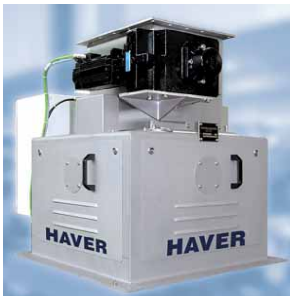
Высокопроизводительные весы, тип 7480 Н