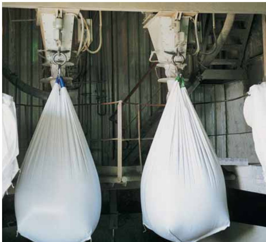
установка для наполнения крупногабаритной тары

На фото представлена двойная установка HAVER Биг-Бэг, тип 7488, установленная на заводе Осколцемент в городе Старый Оскол (Россия), с момента ввода в эксплуатацию она работает бесперебойно.