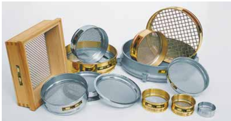
Аналитические сита - группа