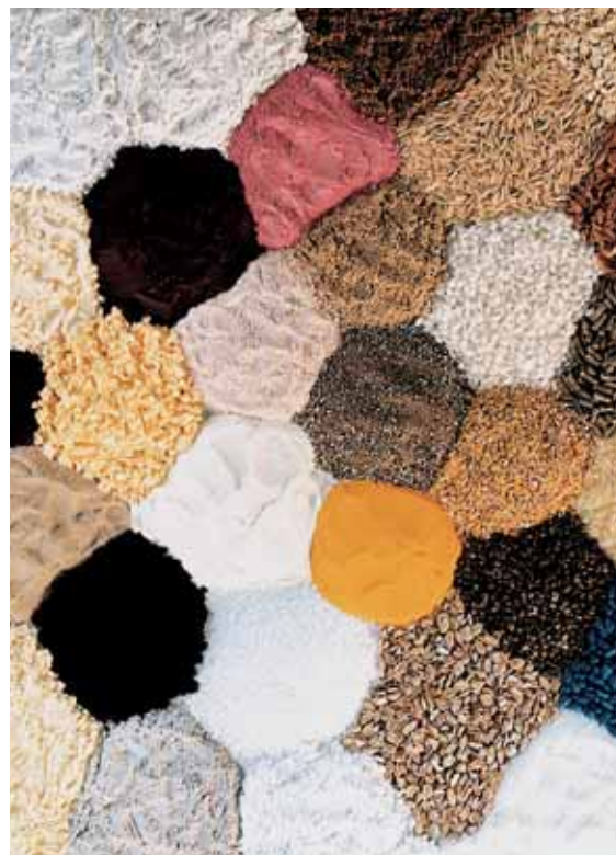
Различные сыпучие продукты